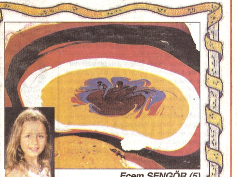
Ecem ŞENGÖR (5)

RESİM-ŞİİR-FIKRALARINI Zİ KOŞEMİZE POSTALAYIN.. ADRES: DR.FARUK AYANOĞLU CADDESİ NO 10 FENERYOLU KADIKÖY-İSTANBUL