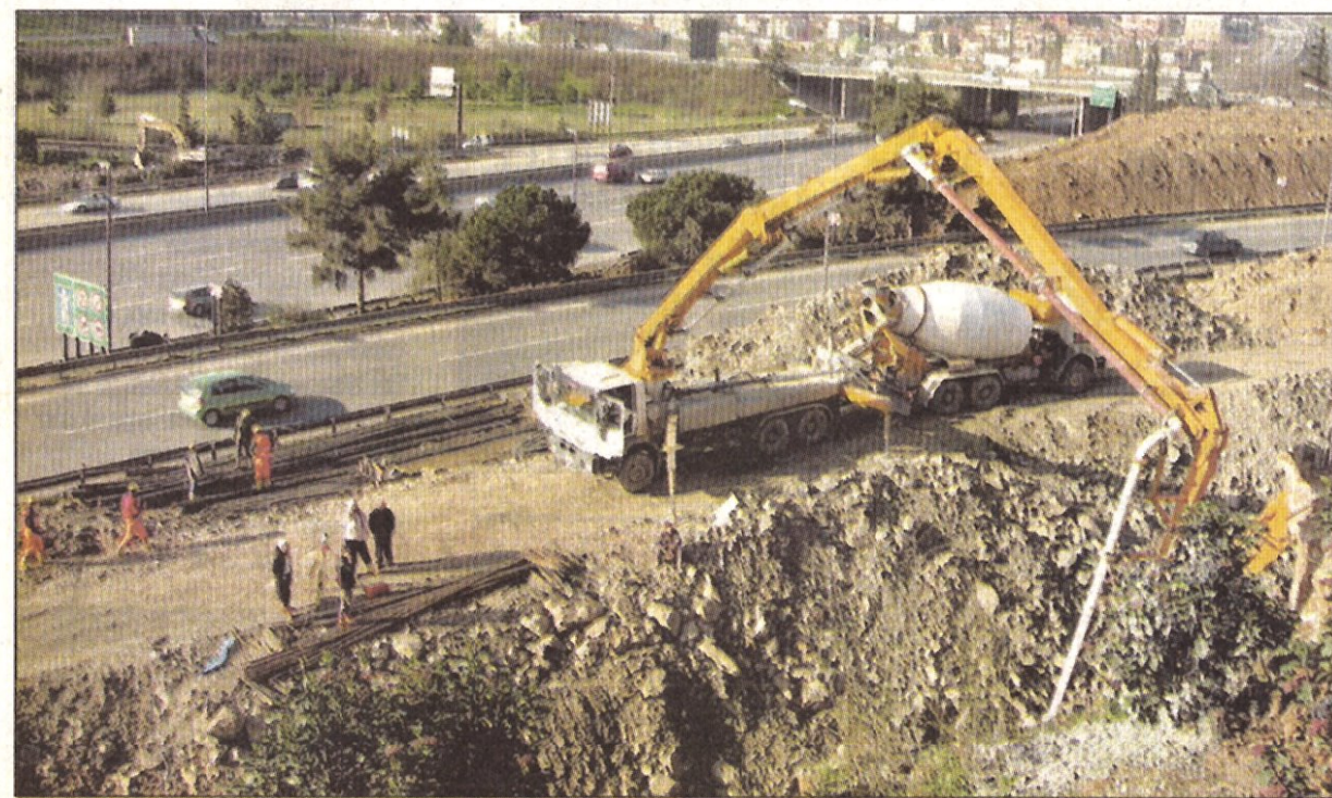
Çalışmalar kapsamında, Kadıköy'de de iki yeni kavşak yapılacak....

İ stanbul Büyükşehir Belediyesi, İstanbul'un ulaşım sorunu çözecek 116 proje geliştirdi. Bu projelerden 20 kavşağın temeli geçtiğimiz günlerde toplu olarak atıldı.