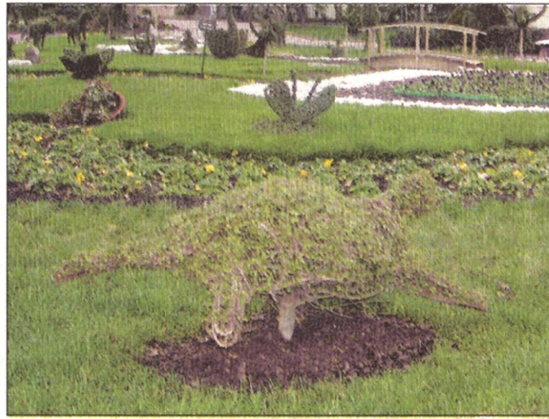
Özgürlük Parkı'ndaki bitkilere hayvan şekilleri veriliyor.

Özgürlük Parkı'nda Topiary sanatı kullanılarak budanan bitkilere, hayvan şekilleri verildi. Türkiye'de çok az örneği bulunan bu uygulamayla Özgürlük Parkı, daha da güzelleşti. Artık bu parkta bitkilerden oluşmuş onlarca hayvan var. Kuş, at, geyik ve fil bunlardan bazıları.